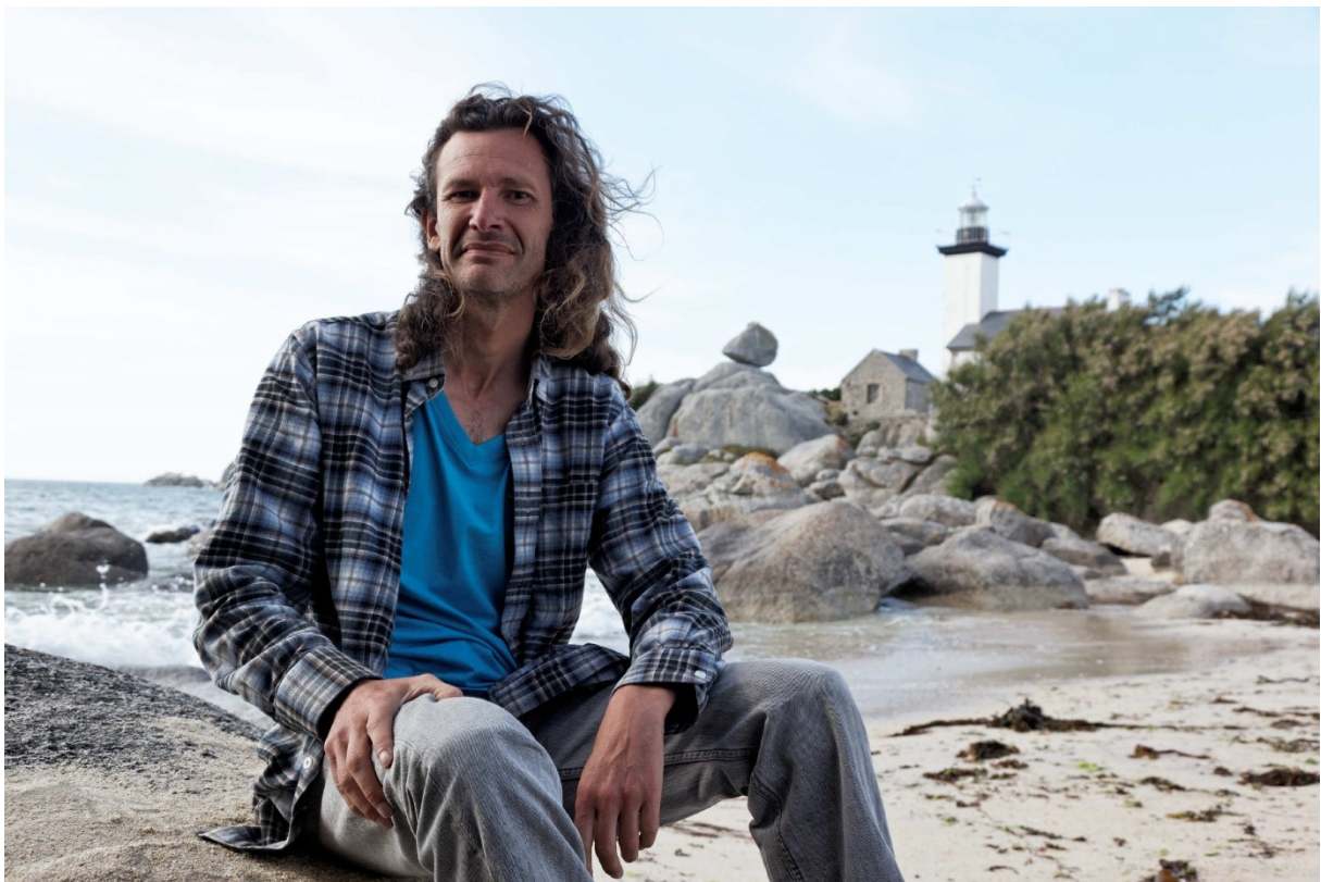
Figure 1 : Devant le phare de Pontusval, là où fut précipitée la "bête" de l'Elorn... (Brignogan plages. Finistère.)