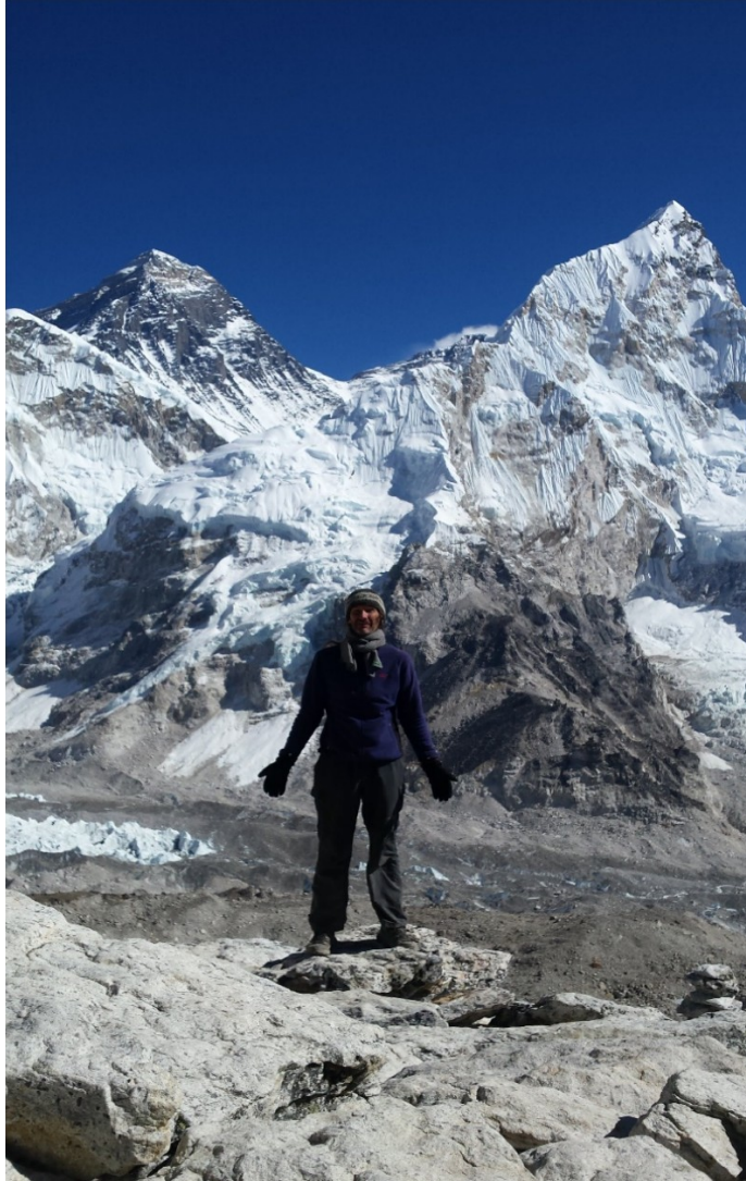
Figure 2: Devant l'Everest depuis le Kala Patthar et ses 5640M.

Malgré un œdème pulmonaire et une expérience mystique entre la vie et la mort, l'aventure s'avère si extraordinairement ésotérique que j'y retournerai plusieurs fois en profitant pour parcourir l'Inde sacrée du Nord ainsi que le petit royaume du Sikkim !