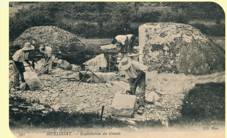
HUELGOAT. — Exploitation du Granite

Ces zones prennent en effet la forme de boules. Durant l'ère Quaternaire, la pluie et le vent déblayent le sable et permettent l'apparition des chaos.